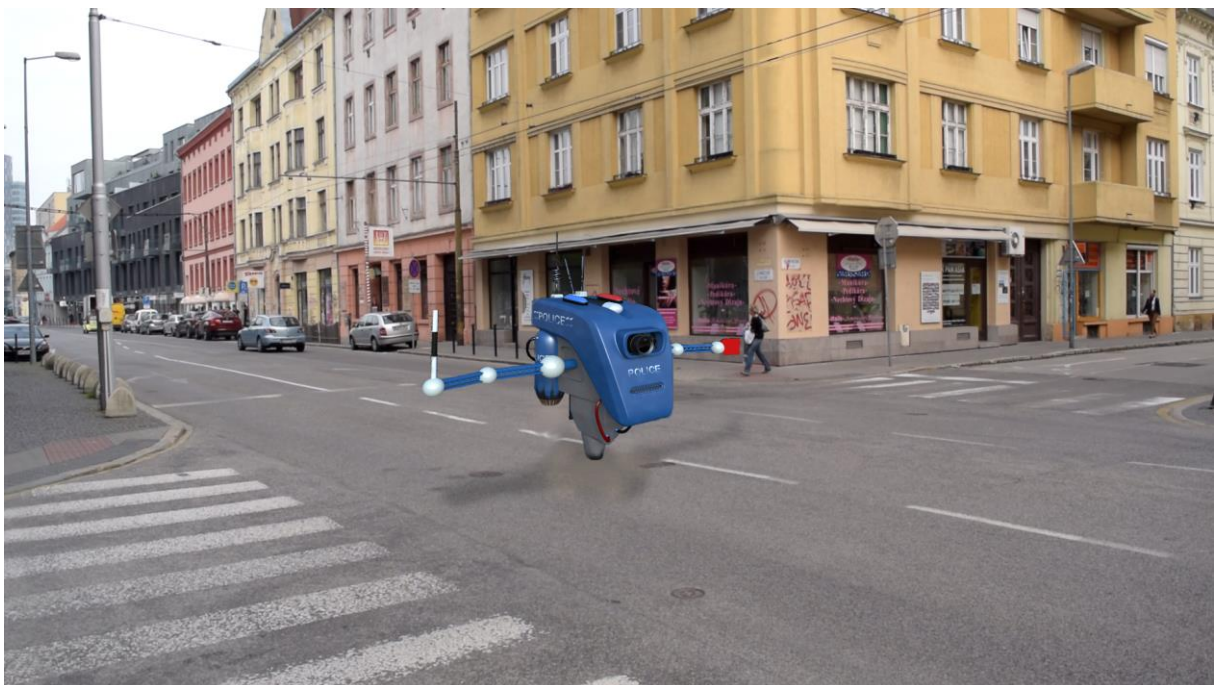
Foto s presným miestom Križovatky, ktorá sa použije pri natáčaní. Robot je tam dosadený nepresne. Technické detaily budú dôkladnejšie pri posprodukcii.